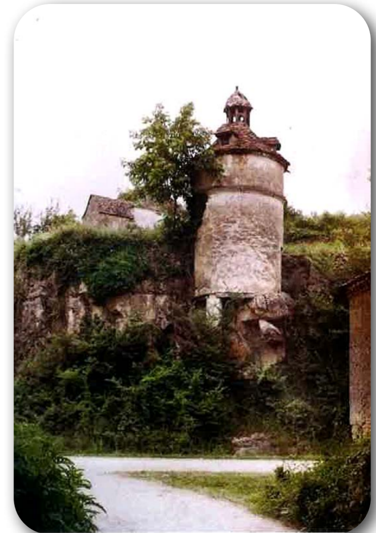
Autochrome conservé au musée départemental Albert Kahn (Boulogne-Billancourt) paru en p.60 du livre Les Couleurs du Périgord en 1916 , éd. du Ruisseau.

Il n'en reste aujourd'hui aucune trace , il a été démonté par M. Courty, maçon, car il menaçait de tomber sur la route. La maison en arrière-plan existe toujours. Le coin de mur visible sur la droite appartenait à la forge du colombier dont une partie du haut-fourneau existe toujours (Cf. bulletin municipal n°9).